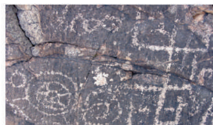
Pinturas do sítio arqueológico